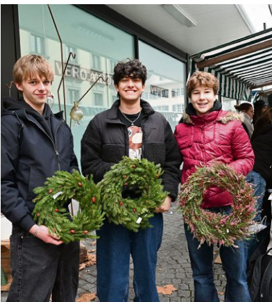
Die Mitglieder der Kränz Junior Company kranzten, was das Zeug hielt.