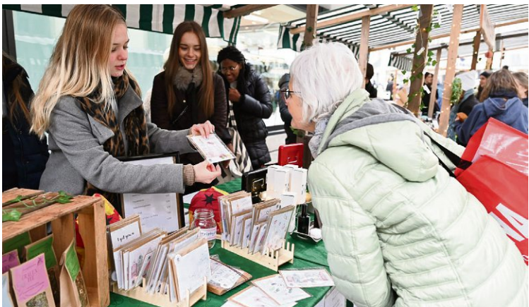
Das Interesse an den Junior Companies-Ständen der Schüler war groß. Sie informierten professionell und verkauften ihre Artikel.